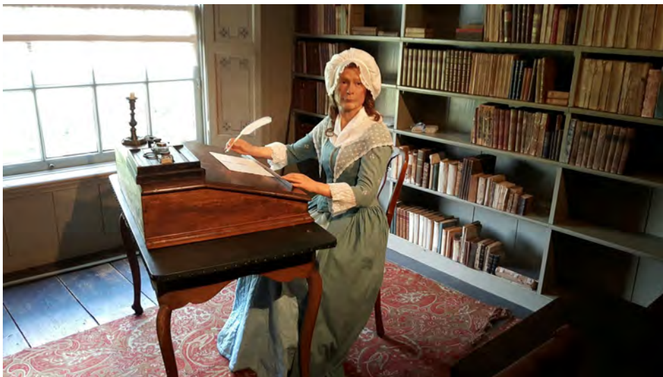
Betje Wolff Museum

Later, na de dood van de dominee, schrijft zij veel boeken samen met Aagje Deken, haar levensvriendin. Onder andere de brievenroman De historie van Mejuffrouw Sara Burgerhart .